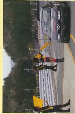
上/タイヤ交換や空圧管理など、みんなで協力してピット作業 下/完走したドライバーをレースクイーンや運営スタッフが祝福し てくれる