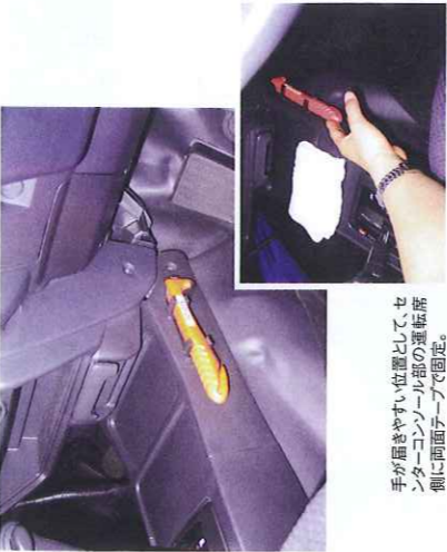
手が届きやすい位置として、セ ンターコンソール部の運転席 側に両面テープで固定。

こうしたいわゆる車内缶詰事故防止に は緊急脱出ツールの常備が有効。丸菱産 業(本社=東京)が製造販売するプラス チック樹脂製ハンマー状の脱出用ツール (商品名「レスキューマン」)はトヨタやホ ンダなど自動車メーカーの純正品に指定 されて新車、中古車への装着が増してい る。ドアガラスを割る軽量小型の特殊ハ ンマーで、柄の部分には特製カッターが納 められ、シートベルトを容易に切断でき る。愛知県では教習車に装備して指導に 乗り出す自動車学校もある。