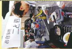
レースを楽しむのももちろん最大の目的 だが、レースの合間には、コンロを使って 料理に腕をふるうなど、バーベキュー感 覚で過ごす時間も1つの楽しみ

もう1つの楽しみは、パドックで過ごす時間。 ハンドルを握る時間はもちろん集中して、いざ クルマを降りたらバーベキューをしたり、料理 を作ったりしながらゆったりとした午後のひと ときをみんなで過ごす楽しみがある。他チーム との交流も活発で、アット ホームな時間を過ごしつ つ、レースでの真剣勝負 を楽しみたい。